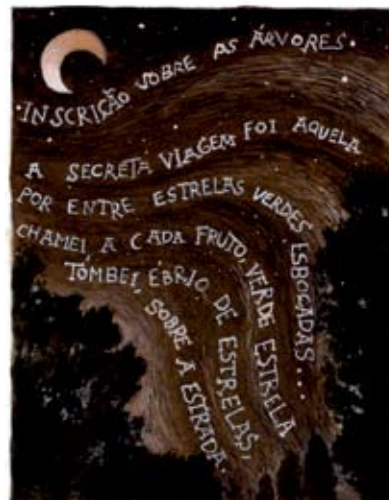
Poema de DAVID MOURÃO-FERREIRA

O haiku é uma forma tradicional de poema japonês. Este tipo de poema obedece a regras e é por isso fácil de construir. Tem apenas uma estrofe, composta por três versos.